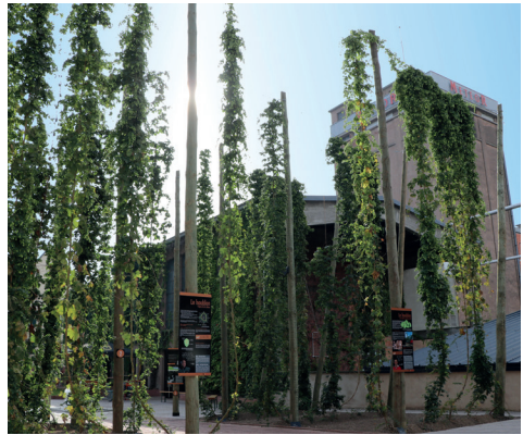
@ Brasserie Meteor